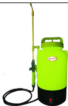
ЭО-5, ЭО-8, ЭО-10