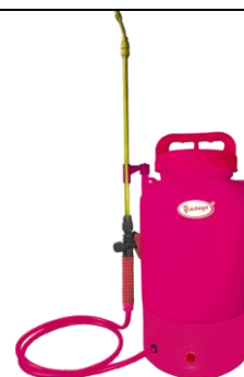
ЭОЛ-5, ЭОЛ-8, ЭОЛ-10